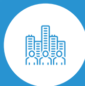
Sociedade em Geral